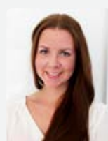
SOFIA BERG Fotograf