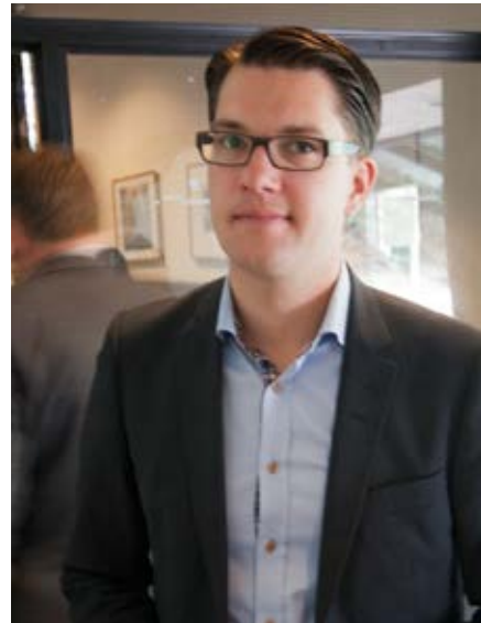
Jimme Åkesson, SDs partiledare

– Det är alltid någon som kommer vara missnöjd. Men det här är ett universitet, vi förväntar oss att människorna här ska vara så mogna att de kan lyssna på även de mest obehagliga åsikter och sedan själva bestämma vad de ska tycka.