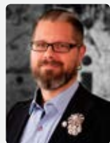
NIKLAS BOLIN DJANAIEFF Fotograf