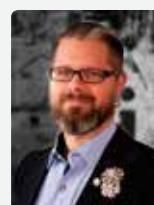
NIKLAS BOLIN DJANAIEFF Fotograf