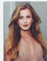
MALIN WESTÉN Fotograf