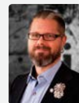
NIKLAS BOLIN DJANAIEFF Fotograf